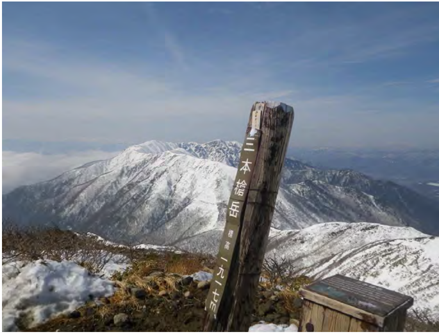
この季節ここまで来られる日が珍しいとのこと