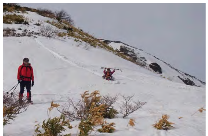
シリセードを楽しむ