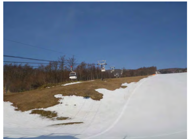
グレンデはこのとおり。田植えが心配です。

那須野ヶ原HHに少し早めに到着、程なく皆参集、6時50分出発、4号線を北上する。那須町に入ると雨が降ったのか湿気っぽい。途中海津さんを乗せる。濃霧が発生し前方が見づらい状態であったがいきなり澄み切った青空と那