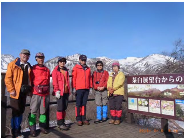
中ノ大倉山展望台にて