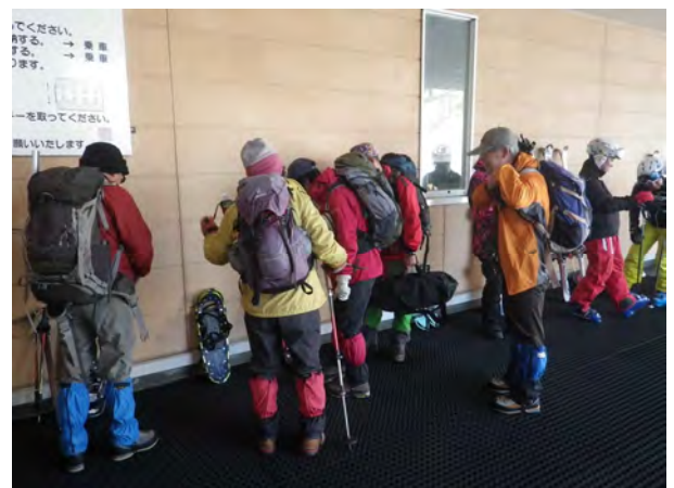
行儀よくゴンドラの運行を待ちます。