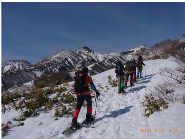
なかなか素敵な景色です