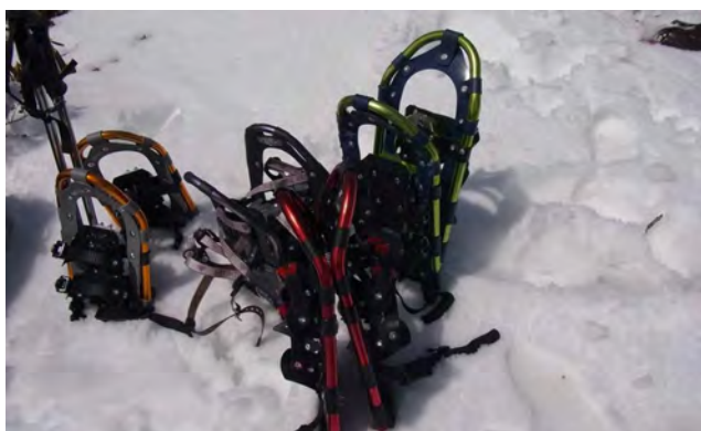
スノーシューをデポ