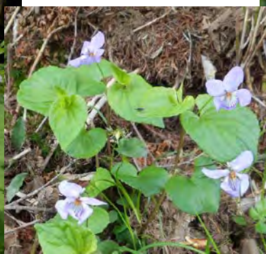
オオタチツボスミレ