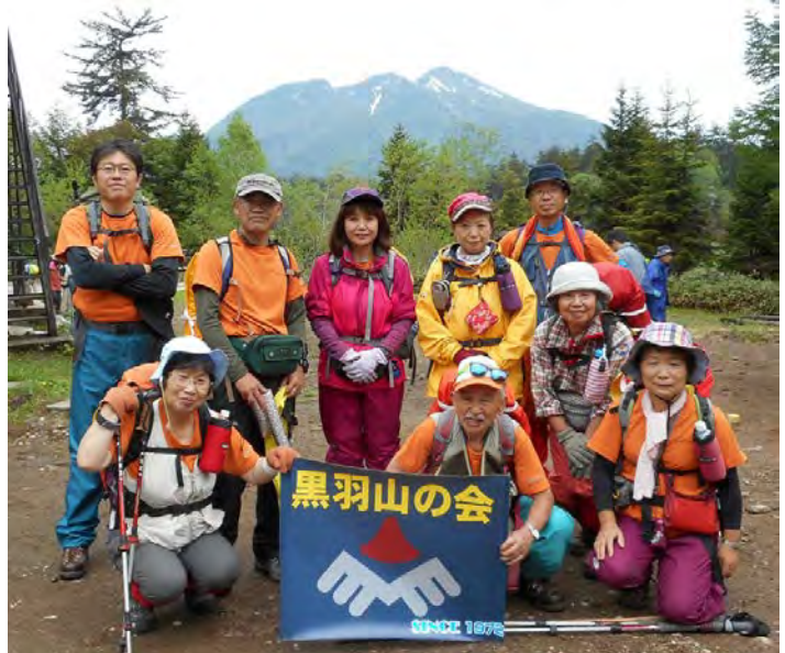
本日参加のスタッフ9名。お揃いのTシャツが素敵です。