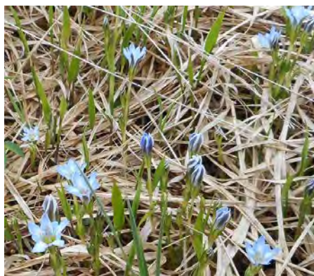
タテヤマリンドウ

ビジターセンター等の軒下などで巣作り、子育てをして秋口に東南アジア方面に渡ってゆくそうです。