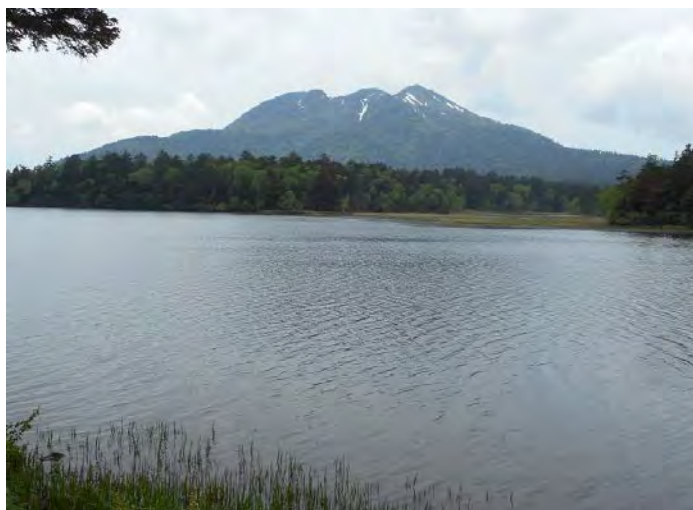
尾瀬沼 バックは東北の最高峰燧ヶ岳

平成22年度から続いている尾瀬ハイキングは6回目となり、今年も尾瀬沼の水芭蕉を見に行くことになりました。