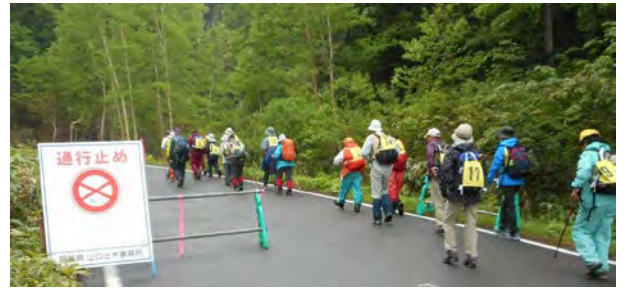
通行止め区間 1.5km を歩く

となっており道端にはハクサンチドリ、ノビネチドリが赤紫色の可憐な花をつけ始めていた。再びシャトルバスに乗り換え沼山峠口で後続バス組と合流し、各班毎に整列して9時10分にCを先頭に総勢37名で尾瀬沼に向けて出発した。