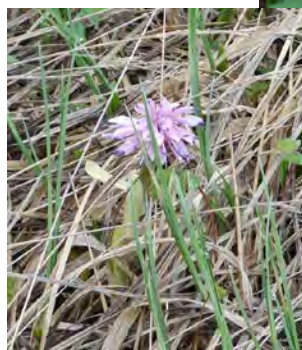
ショウジョウバカマ