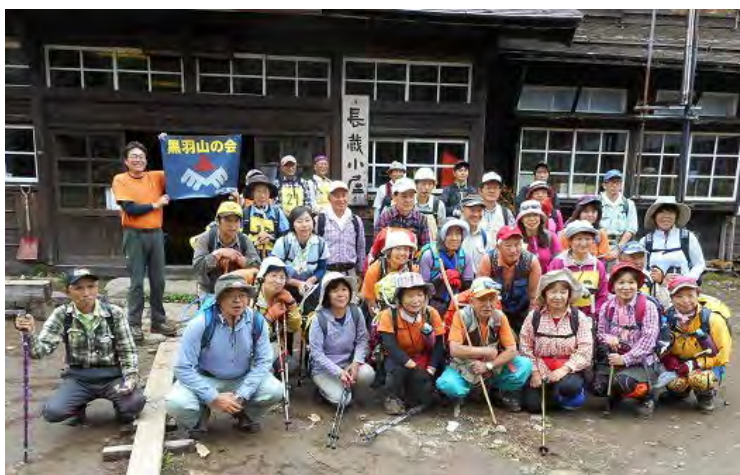
全員の目線の先は？ 長蔵小屋の前で

10時50分ハイカーで賑わっている尾瀬沼ビジターセンター前に到着し、全員で燧ヶ岳をバックに記念写真を撮りＣＬより12時30分長蔵小屋前に集合の指示があり昼食、自由時間とした。私達山の会員は長蔵小屋の休憩所で各々持参したお弁当で楽しい食事が出来、その後付近の散策をした。長蔵小屋の前ではシラネアオイが最盛期を迎えていた。(植栽か?) 小屋の三平峠寄りでは木道から