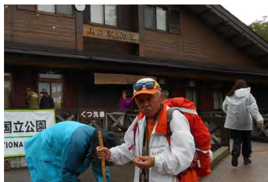
御池に到着 まずすることは「腹ごしらえ!」