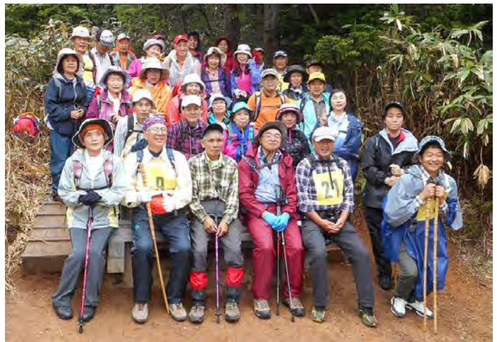
本日最初の記念撮影 沼山峠展望台にて

いよいよ大江湿原が現れすぐにミネザクラがまだ咲いていて、ミズバショウも咲き誇っており木道をゆつくり進みながら植物の観察や写真撮影をしていた。足元を見ればシヨウジョウバカマ、タテヤマリンドウ、小さなヒメシヤクナゲが咲いていて、尾瀬沼に近づくにつれシナノキンバイ、リュウキンカの群生が現れミズバショウとの白と黄色のコントラストは見事である。