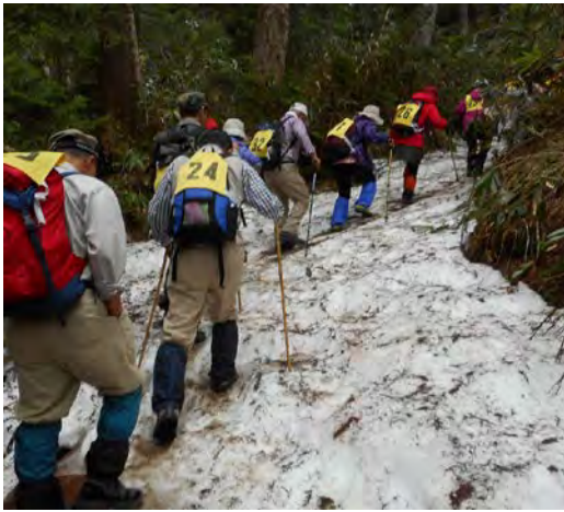
沼山峠休憩所を出発 直ぐに雪渓あり

沼山峠口では雨も止んで空も少し明るくなってきたので今日は雨の心配もなくなり少し涼しい良いコンディションになった。この付近山あり、昨年の台風のためか倒れている木も見受けられ近くではウグイス、カッコウ、ホトトギスの鳴き声が響き春から初夏への移り変わりを感じた。登山道は