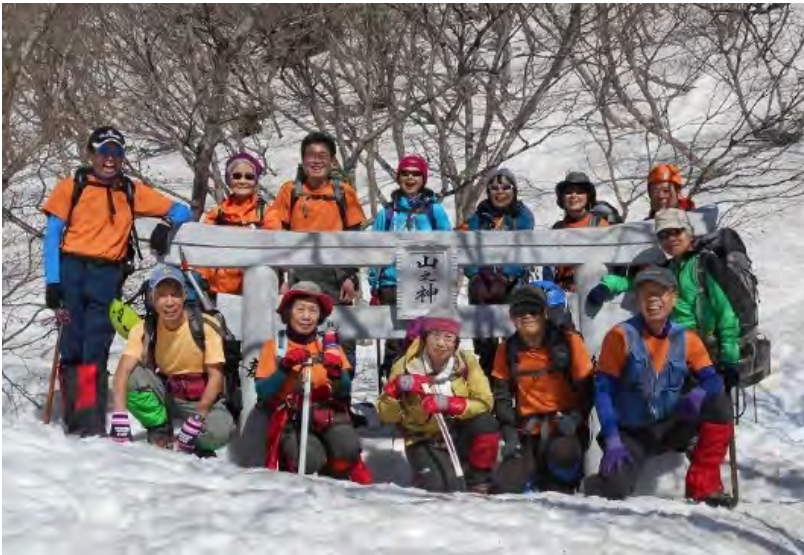
今年は雪がたっぷりです。オイ旗が無いぞ！

茶屋駐車場に到着。突き抜けるような青空を見上げて心も晴れ 晴れいざ山頂へ。登山口の階段は雪に埋もれ周りは雪壁が3〜 4mはありました。登山指導所にて登山届を提出。今年の登山 口の鳥居の隙間は屈んで途通れるぐらいでした。山神様に挨拶 し1枚目の写真となる。狛犬もまったく見え今年には雪が深い ようです。