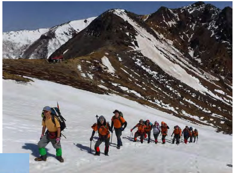
CLを先頭にいつもの剣が峰を後ろに見る

に到着。準備してきた御幣束、お神酒整え神事を行なった。穏 やかな天候の中、空あくまで蒼く天高し。展望は360度の大