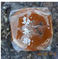
これが佐久山の・・・